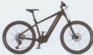
ELEVATION ASL 2025