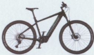
ELEVATION 29 2025